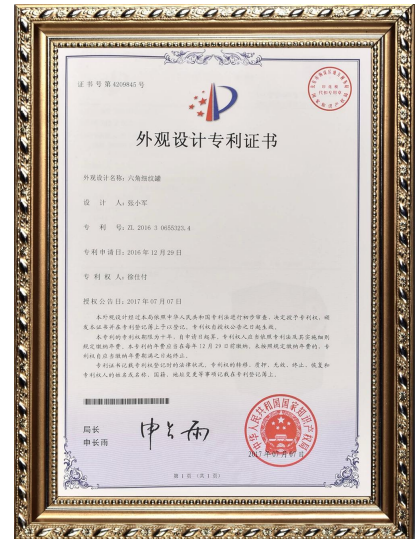
رقم براءة الاختراع: 201630655323.4