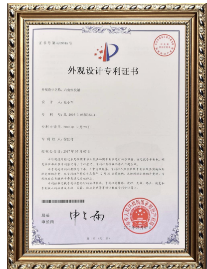
رقم براءة الاختراع: 201630655323.4