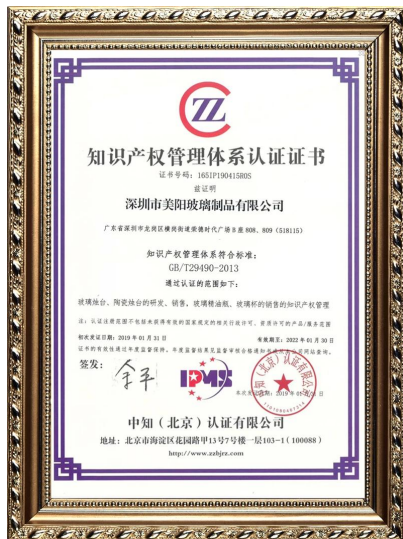
الملكية الفكرية للمؤسسة