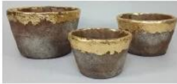
CS10026A-2 20x20x12.5cm CS10026B-2 17x17x10cm CS10026C-2 14x14x9cm