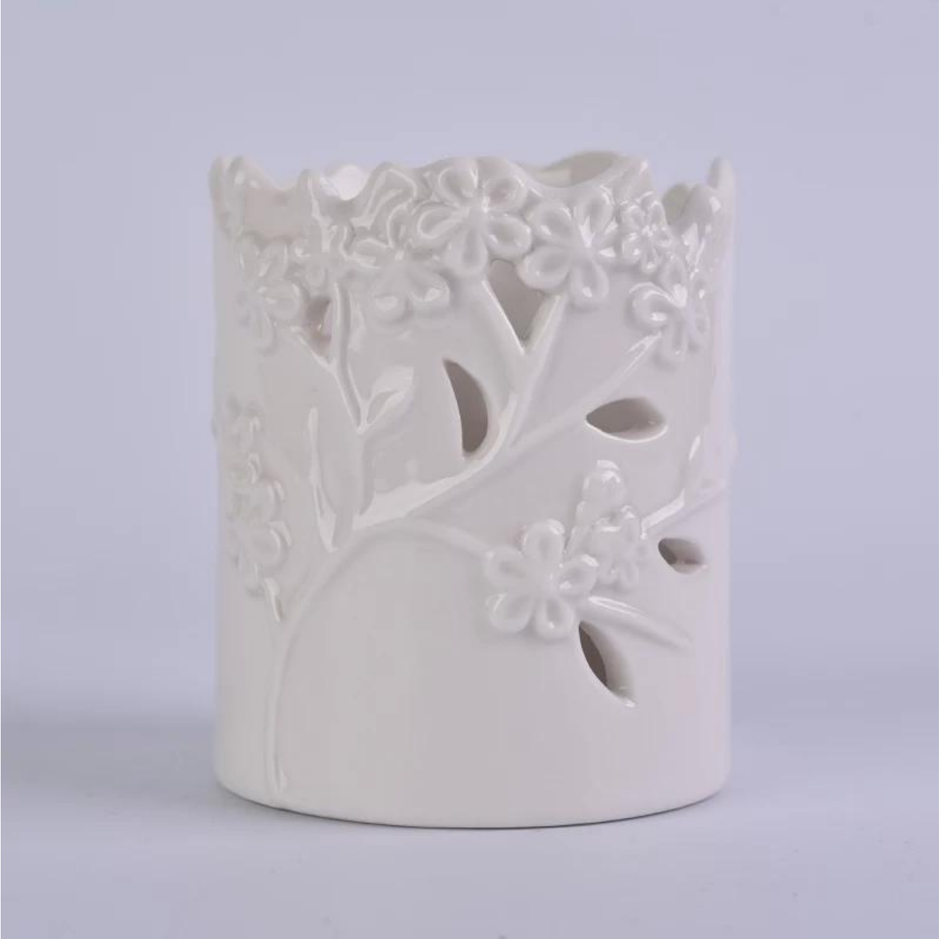
حامل شمعة سيراميك آخر