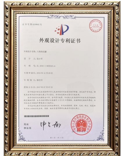
رقم براءة الاختراع: 201630655323.4