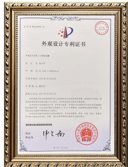
رقم براءة الاختراع: 201630655323.4