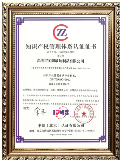
Интеллектуална собственост на предприятието