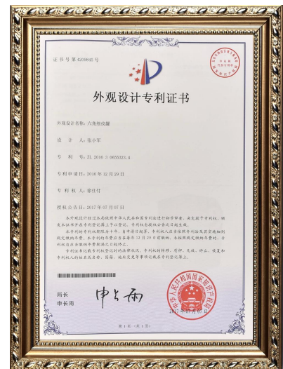
Патент No: 201630655323.4