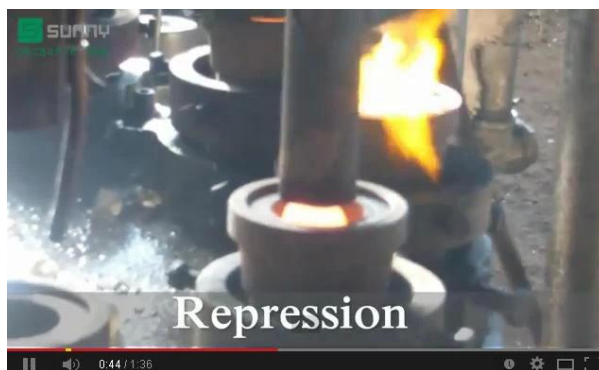
Технология на механичната преса