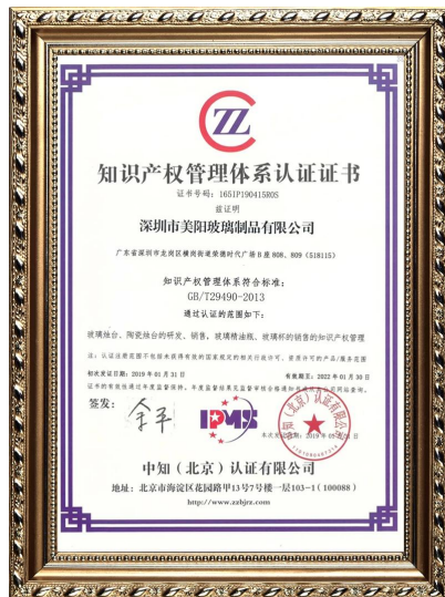
Интеллектуална собственост на предприятието