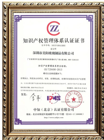
Enterprise Intellectual Property Patent č.:201630655323.4