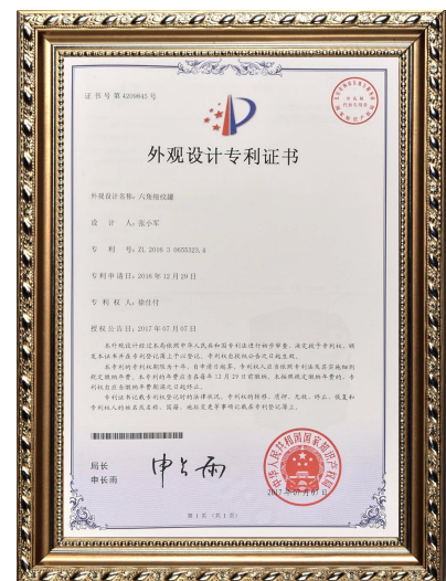
Patent č.: 201630655323.4