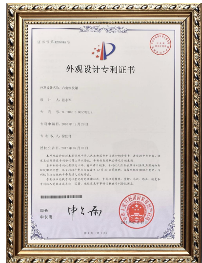
Patent č.: 201630655323.4