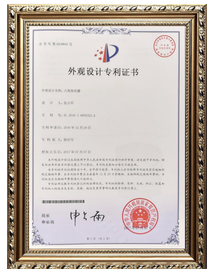
Patent č.: 201630655323.4