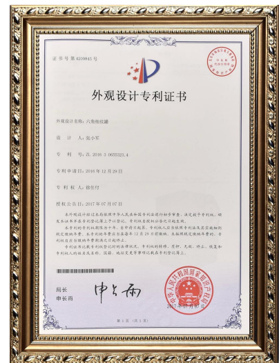
Patent č.: 201630655323.4