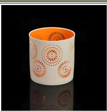
Farbige hohlkeramische Keramik-Votivkerzenhalter