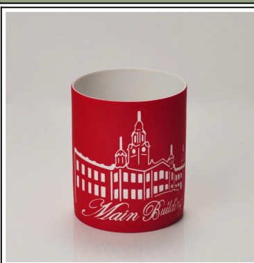
Großhandel farbige Weihnachten hohle Keramik Kerzenglas