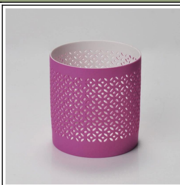
Weihnachts dekorative handgemachte farbige hohle Keramik Kerzenglas