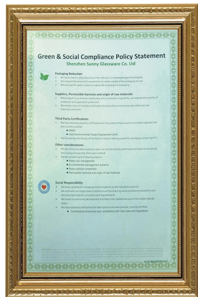
Green & Social Compliance Polidy Statement