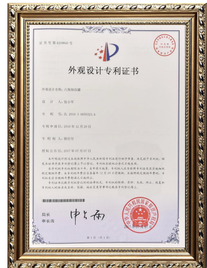
Patent Nr.: 20161630655323.4