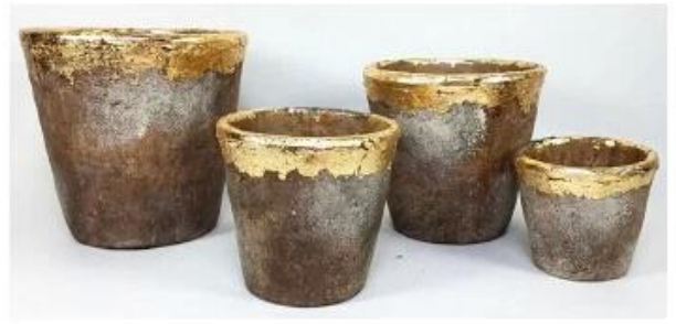
CS10025A-4 20.5x20.5x19.5cm CS10025B-4 17.5x17.5x16.5cm CS10025C-4 14.5x14.5x14cm CS10025D-4 11.5x11.5x10.5cm CS10025E-4 8x8x7cm