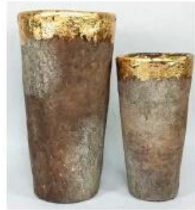
CS10024A-1 14x14x26cm CS10024B-1 11x11x20cm