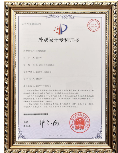
Patent Nr.: 20161630655323.4