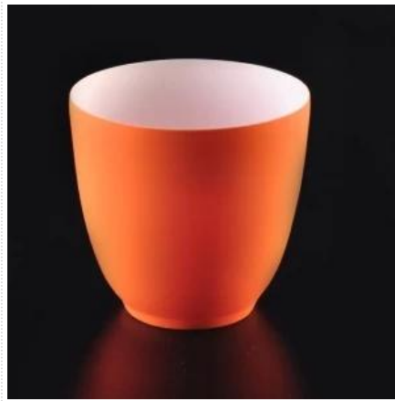
Orangefarbener Keramikkerzenhalter mit dünnerer Wand