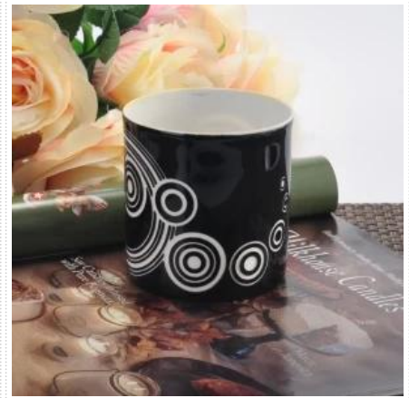
Hochwertige Zylinderkeramik Kerzenglas Großhandel