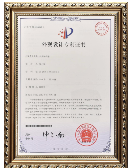
Patent Nr.: 20161630655323.4