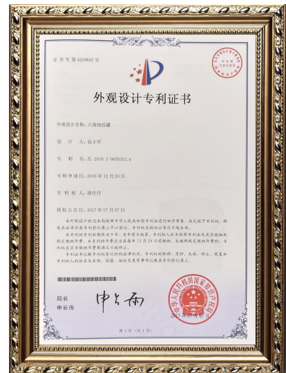
Patent Nr.: 20161630655323.4