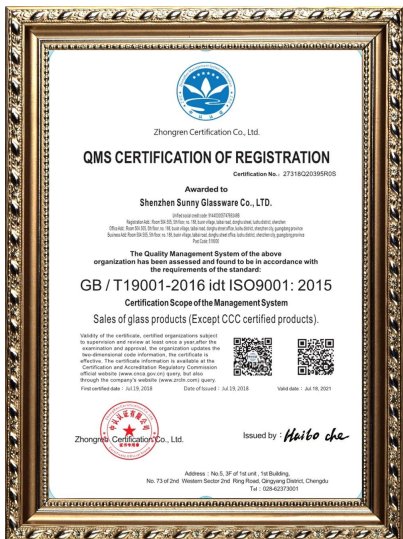
ISO 9001: 2015