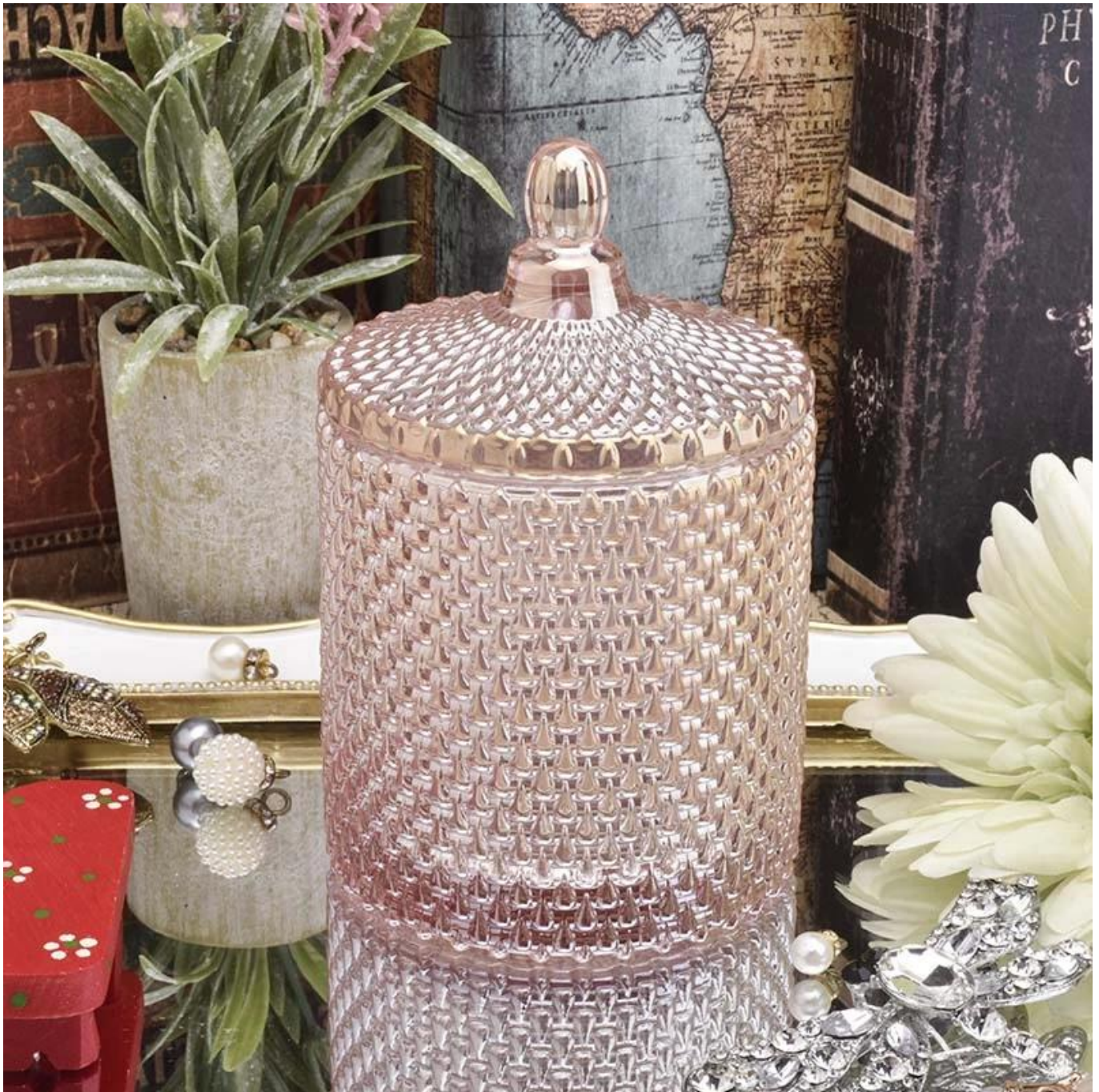
Range of the application