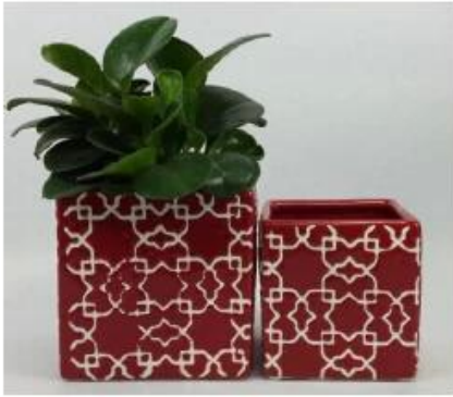
Red S16030-127 12.5×12.5×12.0cm S16030-102 10.0×10.0×10.0cm