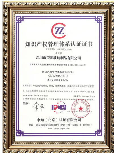
Enterprise Intellectual Property Patent Nr.:201630655323.4