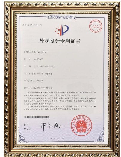
Número de patente: 201630655323.4