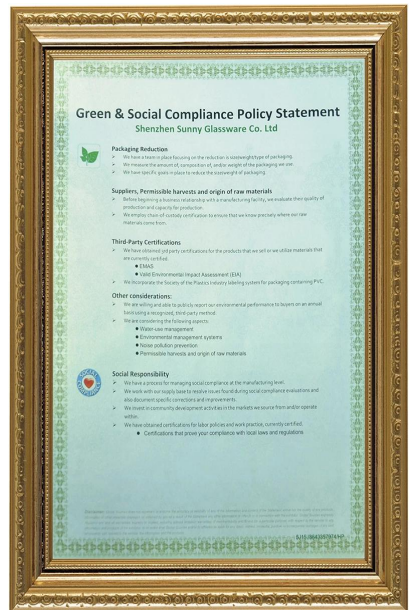
Cumplimiento ecológico y social Declaración de Policy