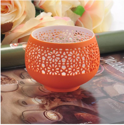
Portavelas de cerámica al por mayor