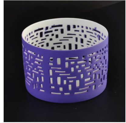
Portavelas votivo de colores