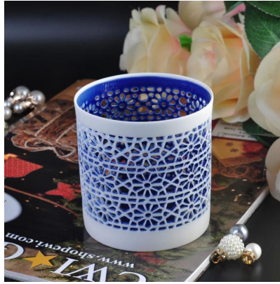
Portavelas de cerámica ahuecado