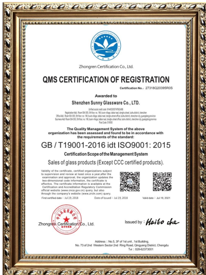
ISO 9001: 2015