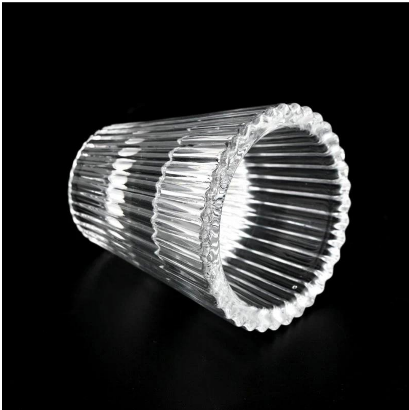
Accesorios para velas