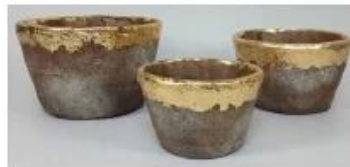
CS10026A-2 20x20x12.5cm CS10026B-2 17x17x10cm CS10026C-2 14x14x9cm