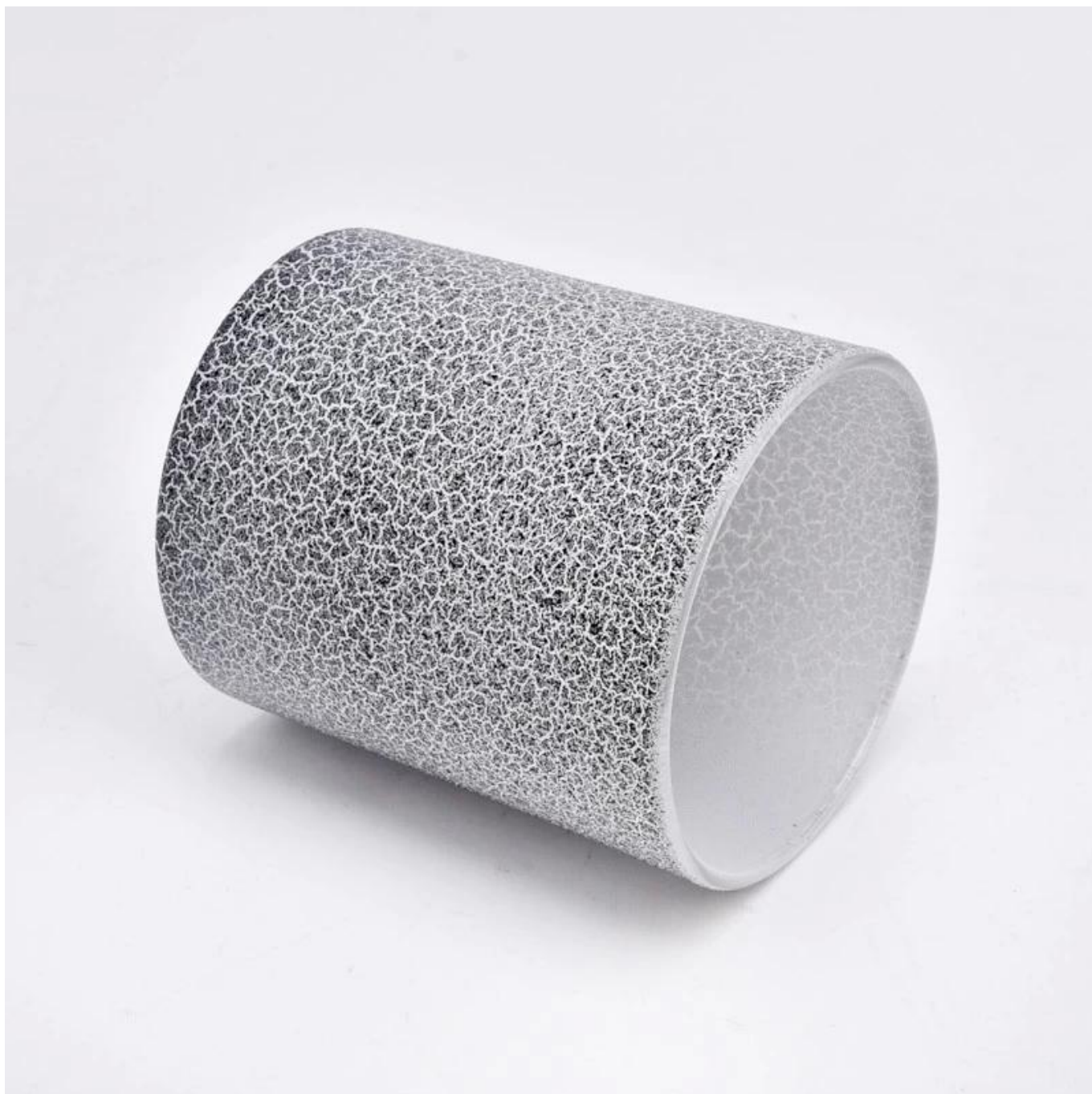
Accesorios para velas