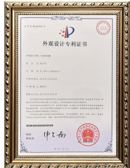
Número de patente: 201630655323.4