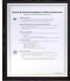
Green & Social Compliance