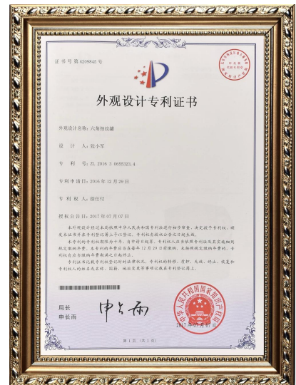
Número de patente :201630655323.4