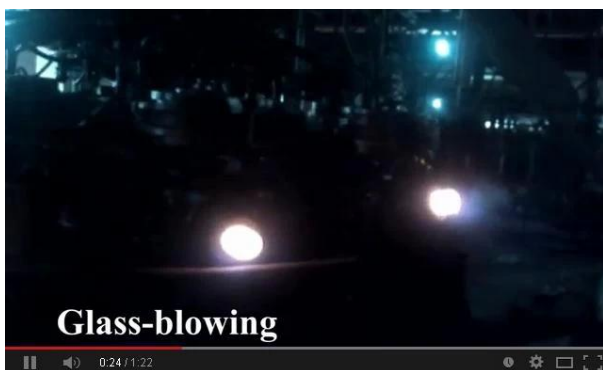
Tecnología de soplado a máquina

Por la presente, mire el video de nuestra línea de producción en línea, bienvenido a visitarnos en el sitio.