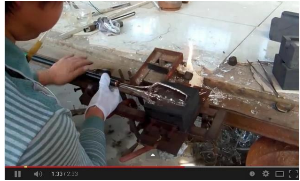
Técnica de soplado a mano