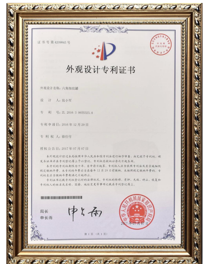
Número de patente :201630655323.4