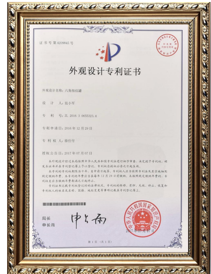
Patentti no: 201630655323.4