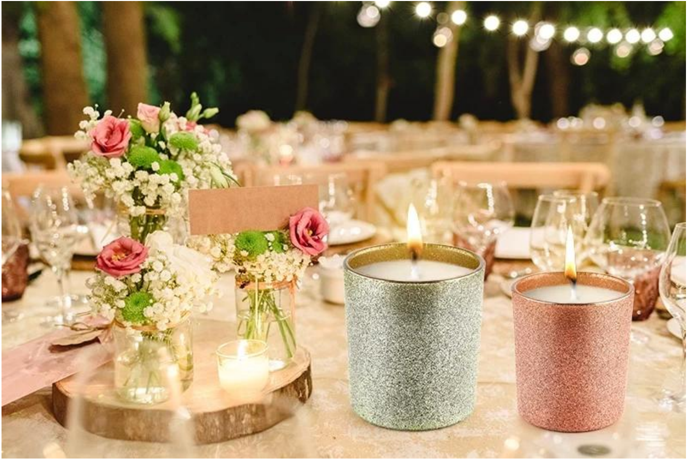
Miksi valita Sunny Glassware