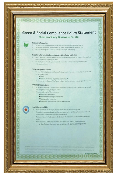
Vihreä ja sosiaalinen vastuu Polidyn lausunto