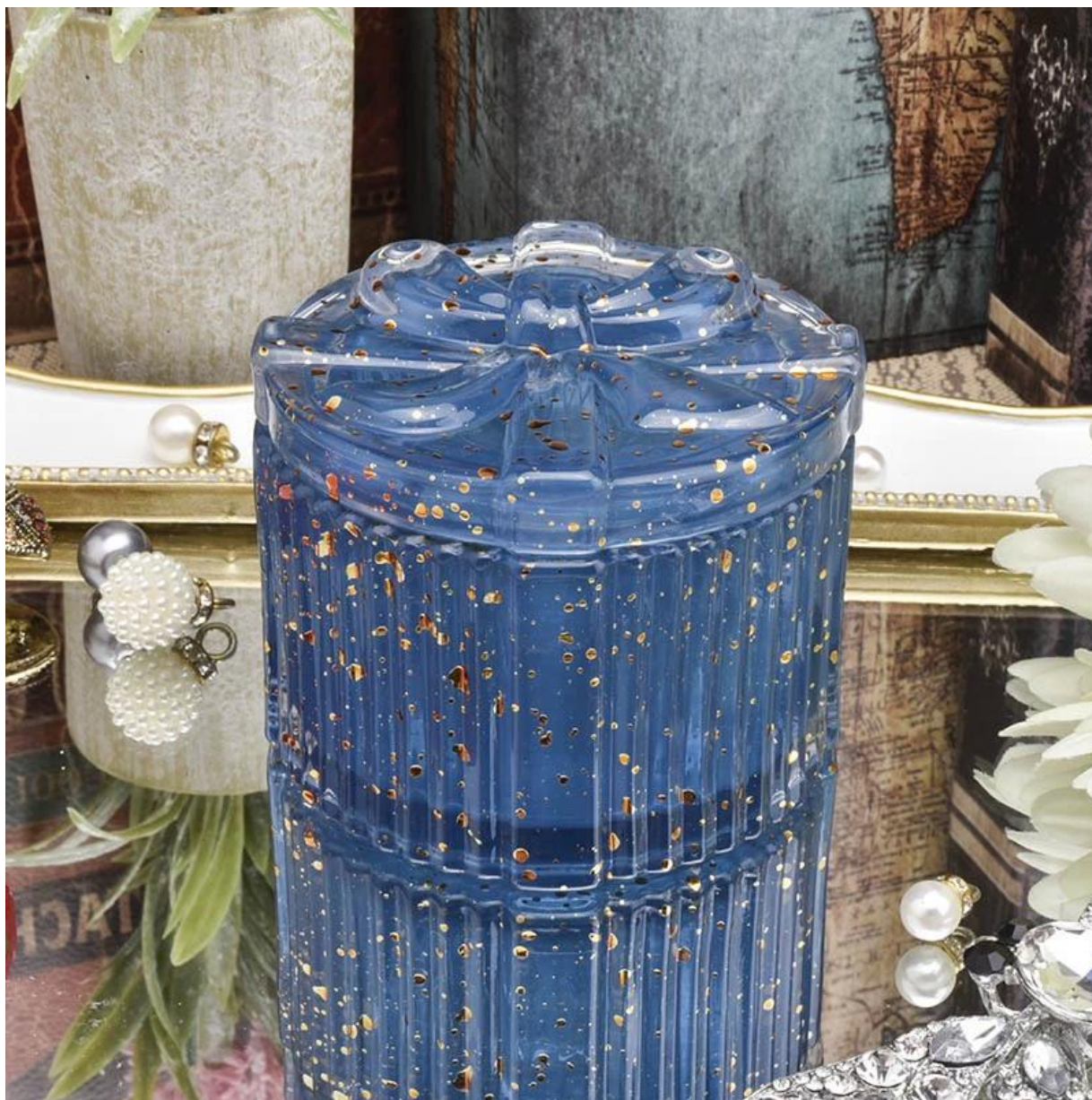
Miksi valita Sunny kynttilänjalka