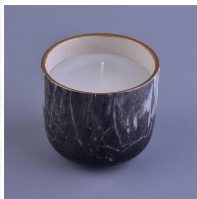
Marmoriset tuksukynttilät keraamisessa kynttilänjalkassa marmoritarratuloistuksella