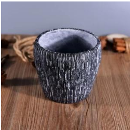
Koristeellinen tyhjä betonikynttilänjalka