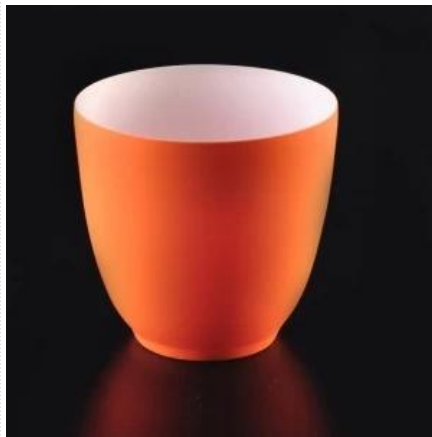
Oranssinvärinen keraaminen kynttilänjalka ohuemalla seinällä