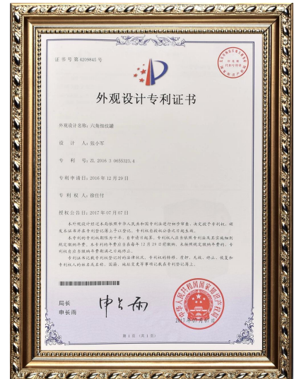
Patentti no: 201630655323.4