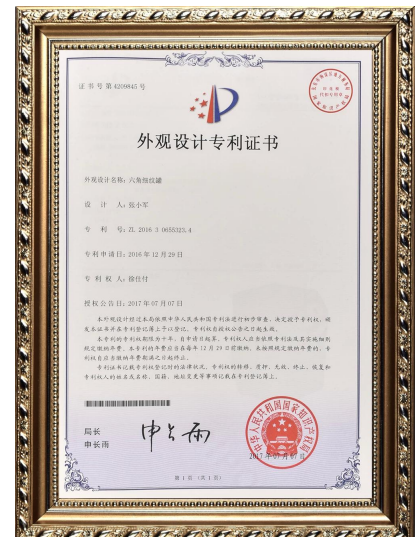
Patentti nro: 201630655323.4