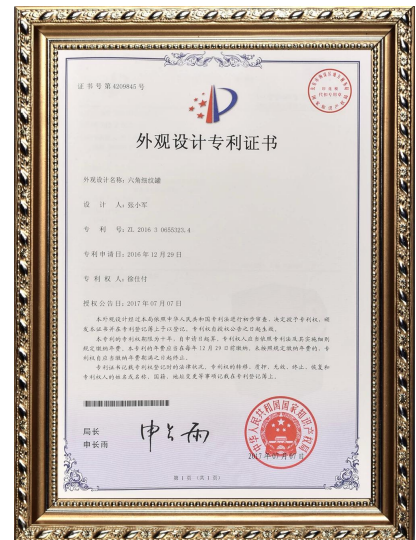
Patentti no: 201630655323.4