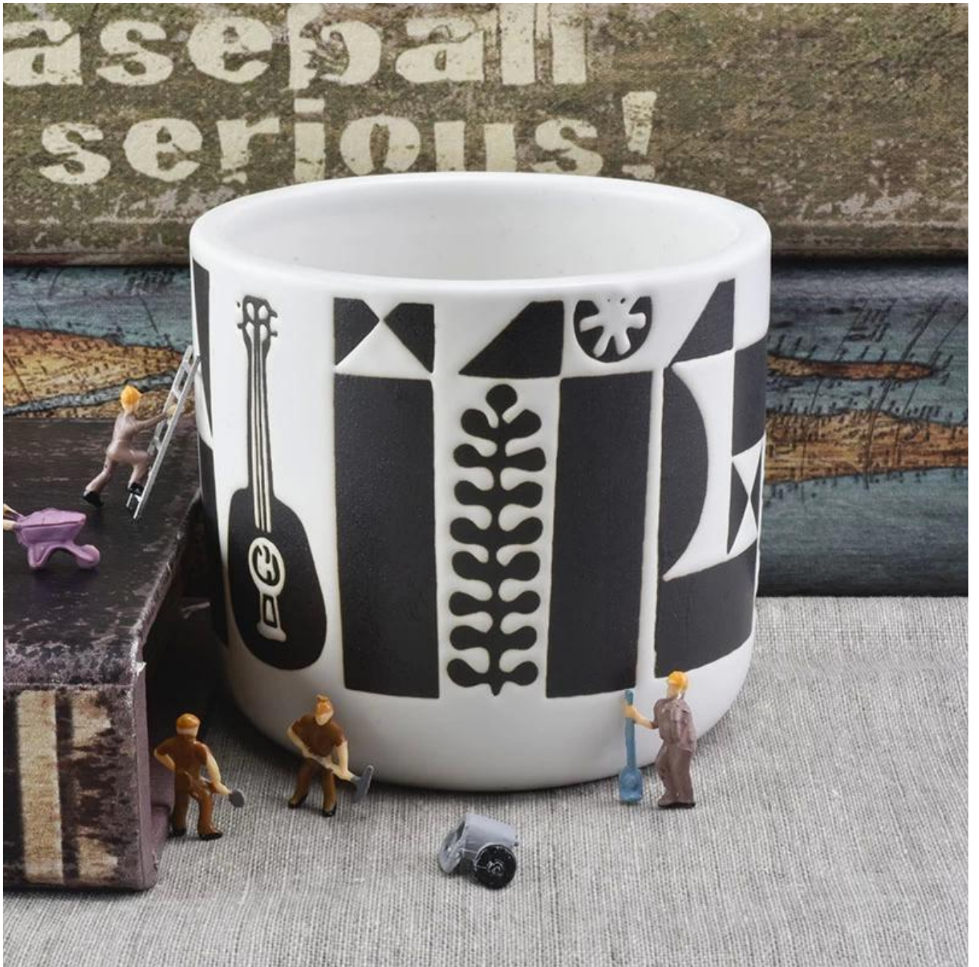
Office & Sample Room