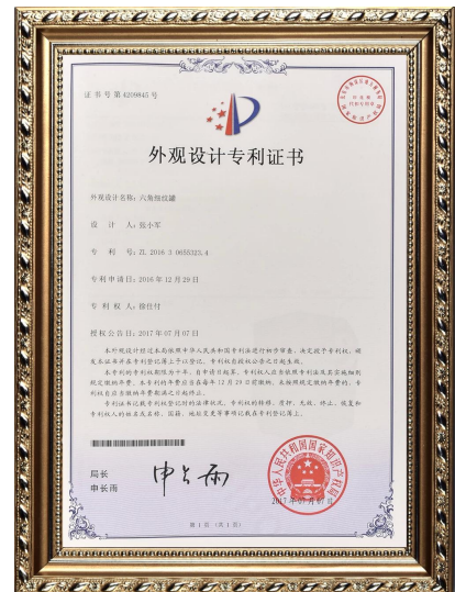
Brevet n °: 201630655323.4