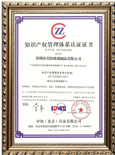
Entreprise Intellectuelle Propriété Brevet N° : 201630655323.4