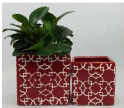
Red S16030-127 12.5×12.5×12.0cm S16030-102 10.0×10.0×10.0cm