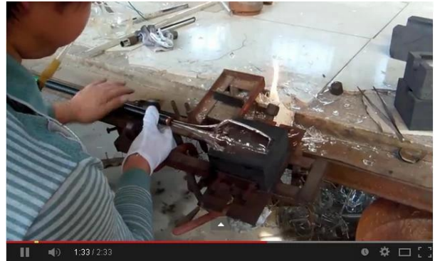
Technologie soufflée à la main