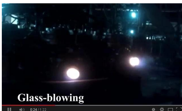
Technologie soufflée à la machine

Par la présente, regardez la vidéo de nos lignes de production en ligne et n'hésitez pas à nous rendre visite sur place.