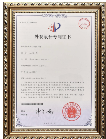
Brevet n °: 201630655323.4