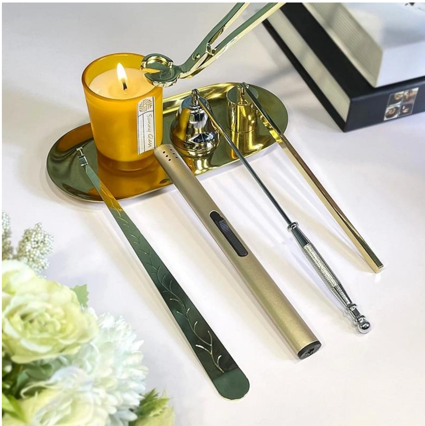
Equipe et Bureau